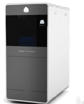
(法人企業向け) ProJet™シリーズ