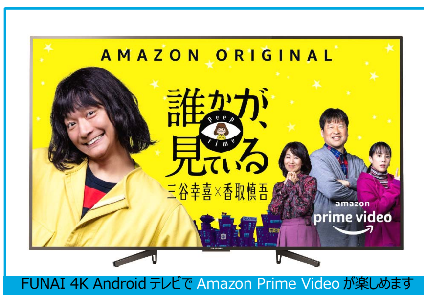
写真は 4K 液晶テレビ <FL-65U5030>

船井電機は、本日より2020年発売のFUNAIブランド4K Androidテレビにおいて、オンライン動画配信サービス「Amazon Prime Video」が視聴できるようソフトウェア更新を開始いたします。対象となる機種は、フラグシップモデル7030シリーズなどFUNAIブランド4K Androidテレビ2020年発売モデルである4シリーズ10機種です。