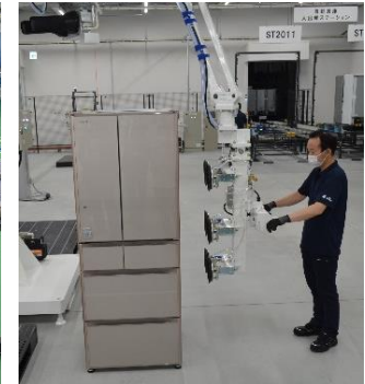
▲自動アームで重たい冷蔵庫の移動も単独での作業が可能