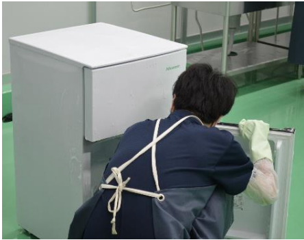
▲冷蔵庫・洗濯機は人の手を介して入念に洗浄