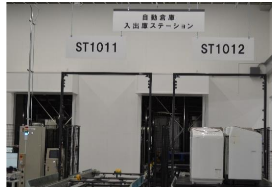
▲商品の入出管理の工程は、ほぼすべてを自動で行う「自動倉庫 入出庫ステーション」を導入し円滑に管理