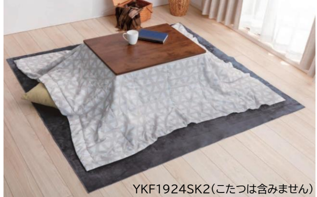
YKF1924SK2(こたつは含みません)