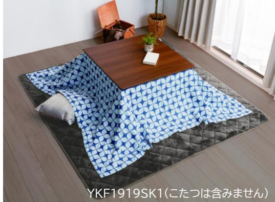
YKF1919SK1(こたつは含みません)