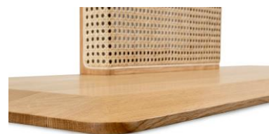
天然木(ナラ材)を使用した 薄型のスタンドベース