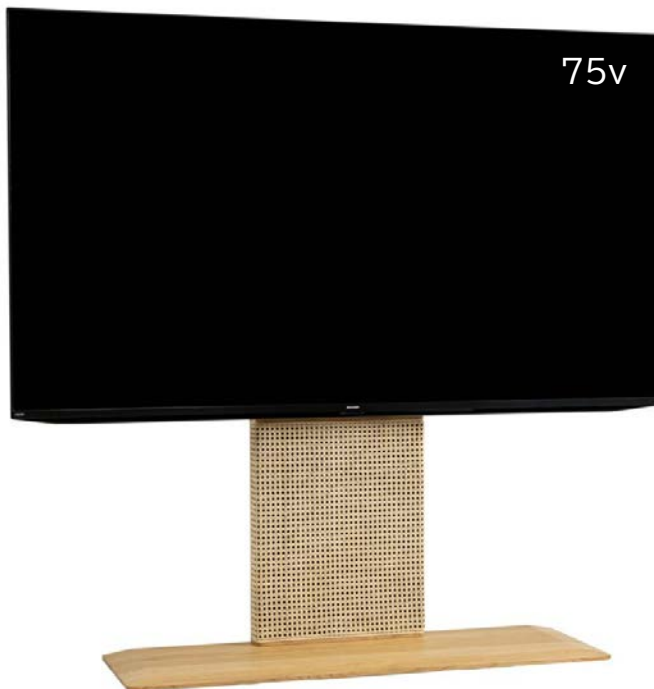
デザイナーの小林幹也氏によるデザイン