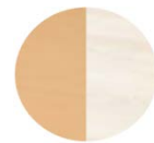
天板 （木目・ホホワイト/リバーシブル）

※製品詳細は弊社ホームページをご覧ください。商品発売に合わせ商品情報掲載いたします。