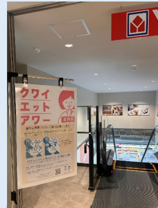
▲店舗入り口のポスター

今後も「クワイエットアワー」を通じて、音や光で過ぎしにくさを感じる方の日常的なお困りごとを解決するとともに、ご来店くださるすべてのお客様が安心して楽しくお買い物いただける環境づくりに向けて努めてまいります。