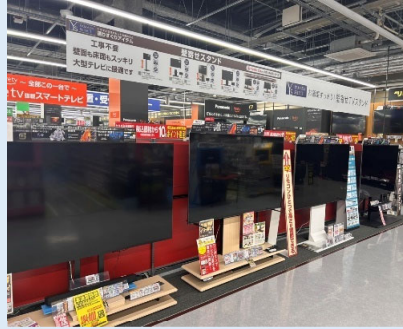
▲展示商品の電源オフ