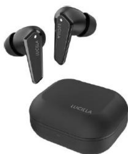
ミッドナイトブラック