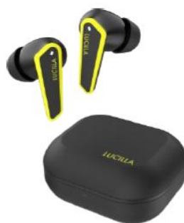
スパークイエロー