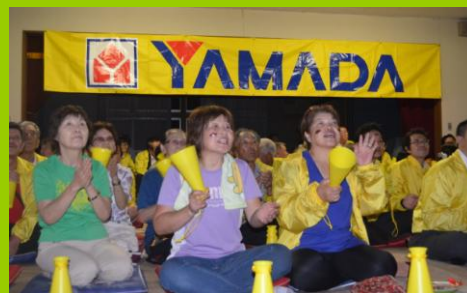
吉岡町の皆様、中継会場より。ありがとうございました