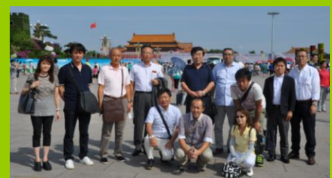
日本から駆けつけてくださった応援団の皆さん